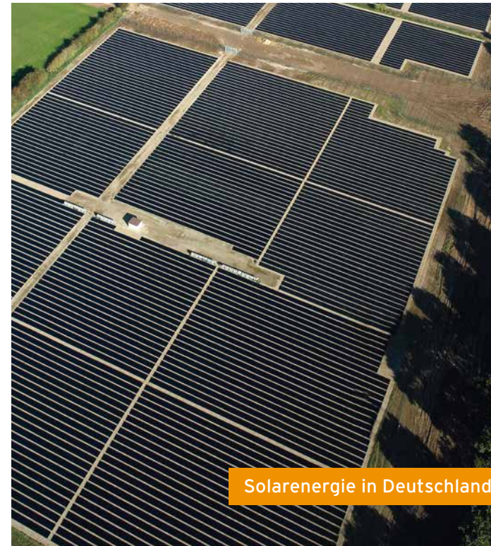
Solarenergie in Deutschland